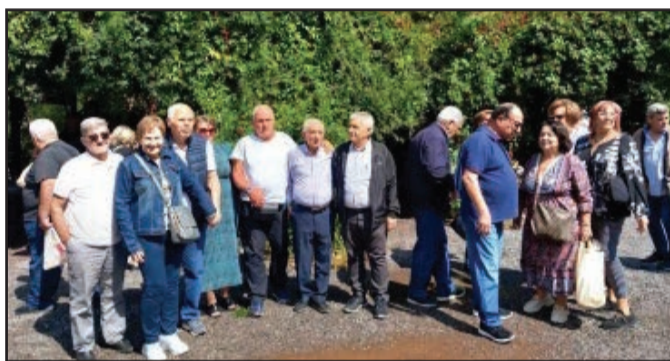
ρες θεματικές διαδραστικές όμορφα. Κατά την διαδρομή καινοτομίες για να περνάν σταματήσαμε στις Θερμοπύλες

Τα Σωματεία Συνταξιούχων Σιδηροδρομικών «Λαρισαϊκός» και «Τ.ΣΠΑΠ» πραγματοποίησαν στις 19/10/2024 εκδρομή στην Παύλιανη. Ένας όμορφος προορισμός όπου οι κάτοικοι τον αξιοποίησαν, δημιουργώντας ένα όμορφο πάρκο με έξυπνες ιδέες όπως η γέφυρα πιάνο. Επίσης έφτιαξαν μονοπάτια, μέσα στο δάσος, για περιπάτους και για τα παιδιά, διάφο-